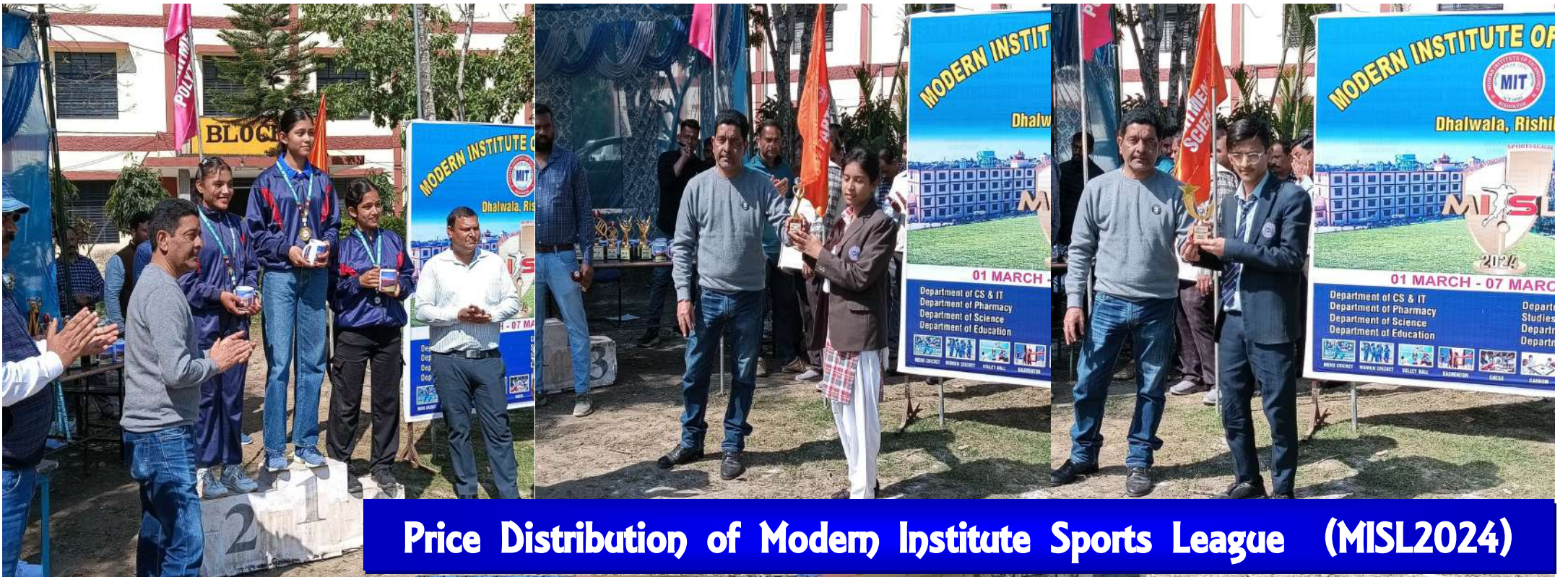
Price Distribution of Modern Institute Sports League (MISL2024)