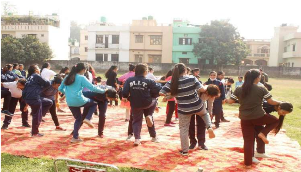
Self-defense classes (15-20 March 2021)