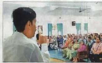
एम की कैंसर ओपीडी में आयोजित कार्यक्रम और एम्आईटी वनस्थान में आयोजित कार्यक्रमों में जानकारी देने विशेषज्ञ। -संवाद