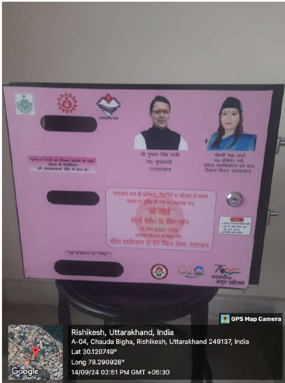
Sanitary napkin vending machine.