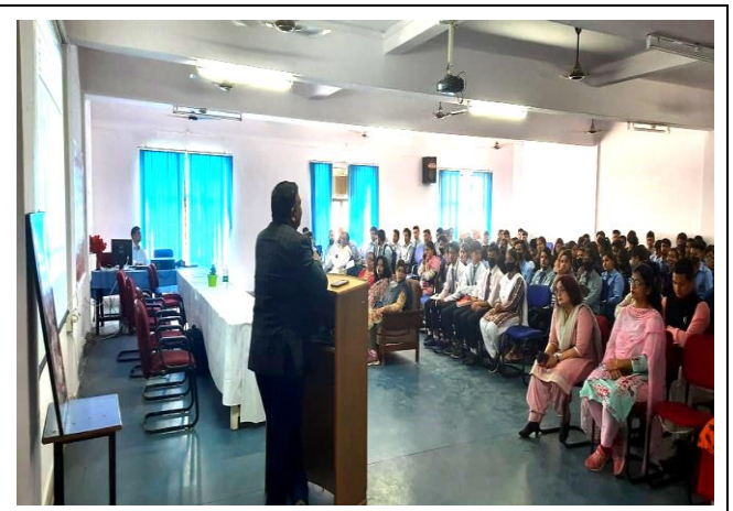
Workshop in progress