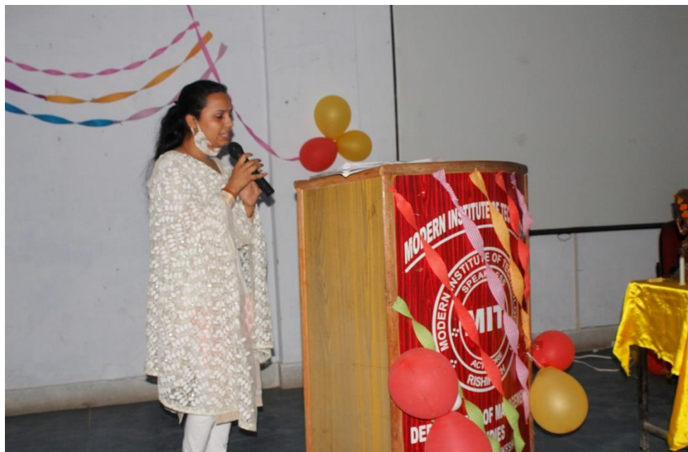
Satyam Shivam Sundaram a short drama by Ms. Rupanshi