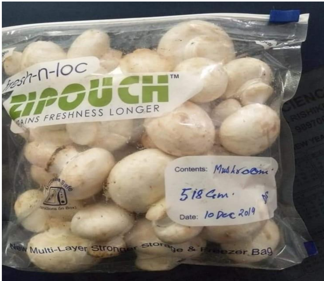
Mushroom bag ready to be sold