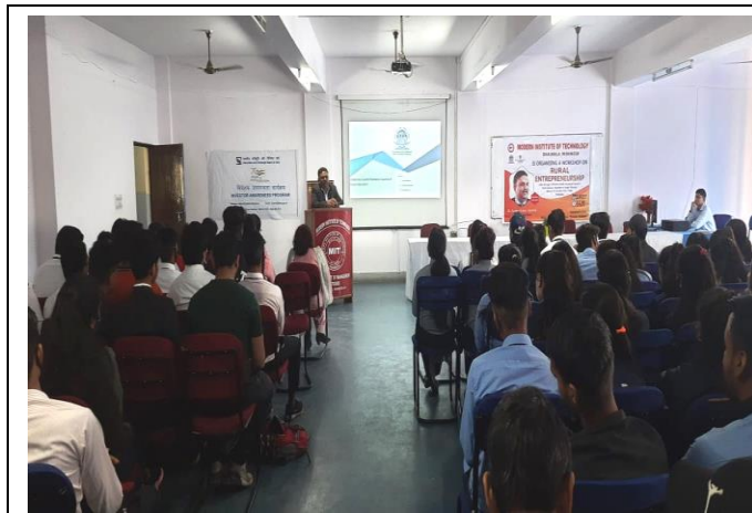
Workshop in progress