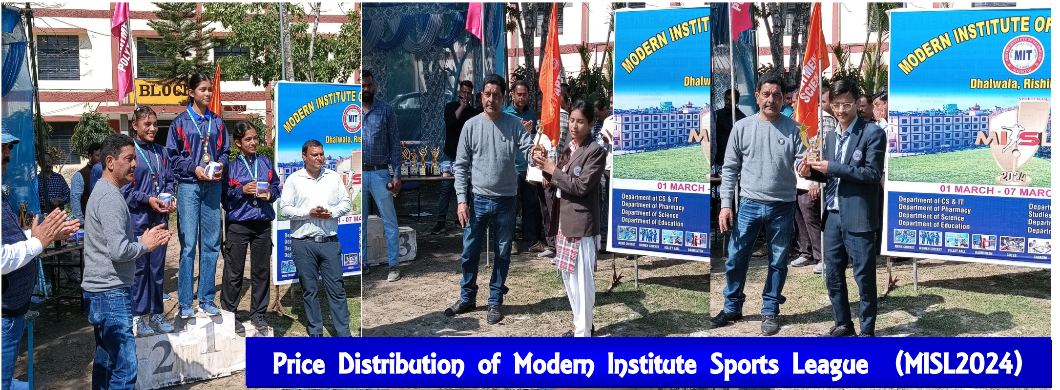
Price Distribution of Modern Institute Sports League (MISL2024)