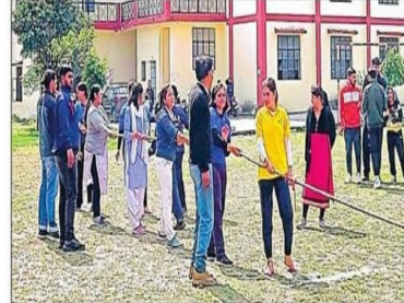
एमआईटी ढालवाला में आयोजित खेल प्रतियोगिता में प्रतिभाग करते छात्र। संत-समन

ऋषिकेश। मॉडर्न इंस्टीट्यूट ऑफ टेक्नोलॉजी ढालवाला में आयोजित एमआईएसएल 2024 खेल प्रतियोगिता के सातवें दिन बालक वर्ग में बीएड और बीकाम के बीच पहला सेमीफाइनल मैच हुआ। बीकाम की टीम ने मुकाबला जीतकर फाइनल में प्रवेश किया। दूसरा सेमीफाइनल आईटी और फार्मसी के बीच खेला गया।