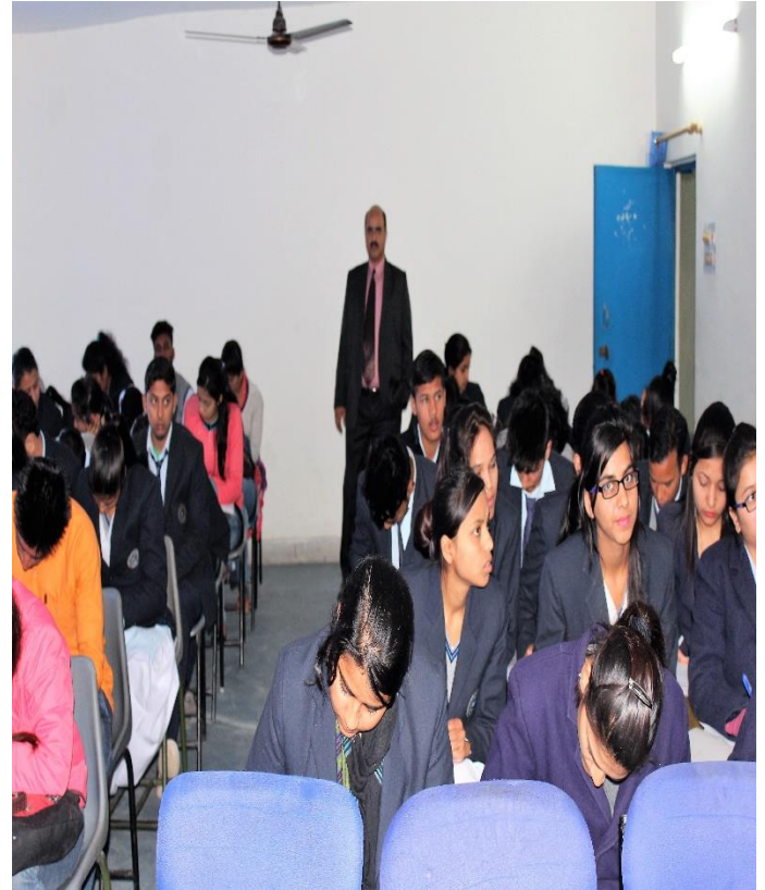
B.Sc. IT, Life Science, PCM and BCA students